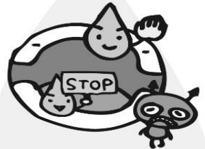
くち なか きん 口の中をばい菌からまもる