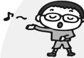
こえ 声をだしやすくする