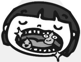
くち なか あら なが 口の中を洗い流す