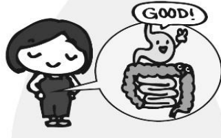
た しょうが たす 食べものの消化を助ける